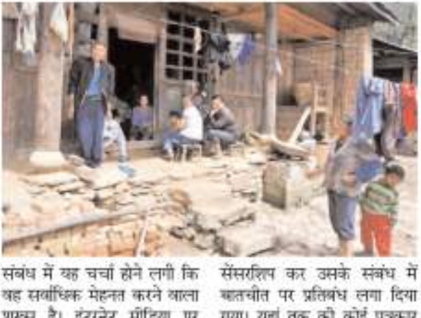
संबंध में यह चर्चा होने लगी कि यह सर्वाधिक मेहनत करने वाला शख्स है। इंटरनेट मीडिया पर

बीजिंग। चीन दुनिया के सामने अपनी समृद्ध और विकसित तस्वीर रखने और देश की गरीबी को दुनिया में किसी को पता न चले, इसके लिए चाल चल रहा है। चीन इस संबंध में गरीबी, वृद्ध और विकलांग के वीडियो इंटरनेट से हटा रहा है। एक रिटायर महिला ने वीडियो बनाया था इसमें उसने 100 युआन (14.50 डॉलर) से खरीदे जा सकने वाले किंगने के सामान की वीडियो बनाई थी। यह वीडियो इंटरनेट मीडिया पर वायरल हो गया। इसे चीनी अधिकारियों की ओर से डिलीट कर दिया गया।