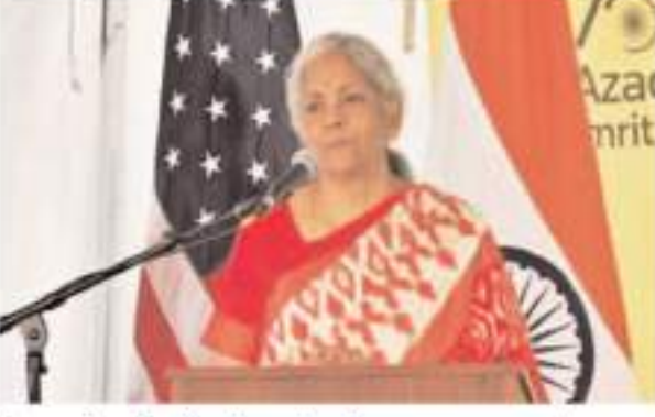
वित्तरता के मुद्दों की समीक्षा की जाएगी। इस दौरान अमेरिका में वित्तिकान वेली बैंक और सिग्नेचर बैंक की विफलता और क्रेडिट सुधार के खामने नकदी

नई दिल्ली। केंद्रीय वित्त मंत्री निर्मला सीतारमण वित्तीय स्थिरता एवं विकास परिषद (एफएसडीसी) की आज आयोजित बैठक में शामिल होंगी। इस दौरान वह वैश्विक और घरेलू चुनौतियों के बीच अर्थव्यवस्था की स्थिति की समीक्षा भी करेंगी। सूत्रों ने बताया कि वित्त मंत्री निर्मला सीतारमण आज एफएसडीसी की आयोजित 27वीं बैठक की अध्यक्षता करेंगी। इस उच्चस्तरीय बैठक में रिजर्व बैंक ऑफ इंडिया (आरबीआई) के गवर्नर शक्तिचक्र दास समेत वित्तीय क्षेत्र के सभी नियामक हिस्सा लेंगे। एफएसडीसी क्षेत्रीय नियामकों का एक शीर्ष निकाय है, जिसकी अध्यक्षता केंद्रीय वित्त मंत्री करती है। इस बैठक में मौजूदा वैश्विक और घरेलू आर्थिक हलचल और वित्तीय संकट के महानजर बैंकिंग और एनबीएफसी क्षेत्र पर भी विचार किया जाएगा। इसके साथ एफएसडीसी समयावधि आर्थिक वृद्धि हासिल करने के लिए इसमें पहले किए गए उपायों की समीक्षा भी करेगी।