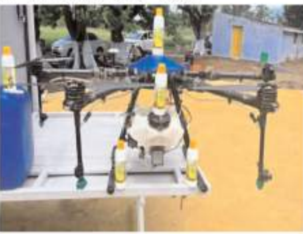
किसानों को स्मार्ट खेती की ओर बढ़ाने में मदद मिलेगी। इस कार्यक्रम का मुख्य फोकस एक सफल ड्रोन डिडकाव प्रणाली का निर्माण करना, ग्रामीण युवाओं व किसानों के साथ समन्वय से प्रणाली को संचालित करना और उन्हें उन्नत प्रौद्योगिकियों में प्रशिक्षित करना है। जिससे ग्रामीण क्षेत्रों में उद्यमिता को बढ़ावा मिल सके।

नई दिल्ली। भारतीय किसान उन्नयन सहकारी (इएके) कृषि विश्वविद्यालयों और तकनीकी संस्थानों के तकनीकी सहयोग से अखिल भारतीय स्तर पर ड्रोन और आर्टिफिशियल इंटेलिजेंस प्रौद्योगिकियों का उपयोग करके नैनो यूरिया व नैनो डीएपी जैसे नैनो उर्वरकों के उपयोग को बढ़ावा देने की योजना बना रहा है। ड्रोनएआई एक एकीकृत कार्यक्रम है जो ड्रोन, नैनो, आर्टिफिशियल इंटेलिजेंस और मोबाइल प्रौद्योगिकियों के संयोजन से नैनो उर्वरकों व अन्य कृषि रसायनों चरणबद्ध अनुप्रयोग को बढ़ावा देता है।