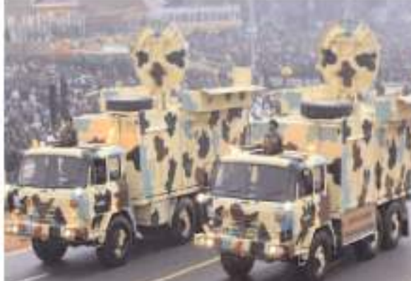
प्रतिष्ठानों को भी अनुमति देने जा रही है। परिचयी देशों की तर्ज पर संभावित खरीदार देशों में अफसरों की तैनाती बढ़ाने की तैयारी