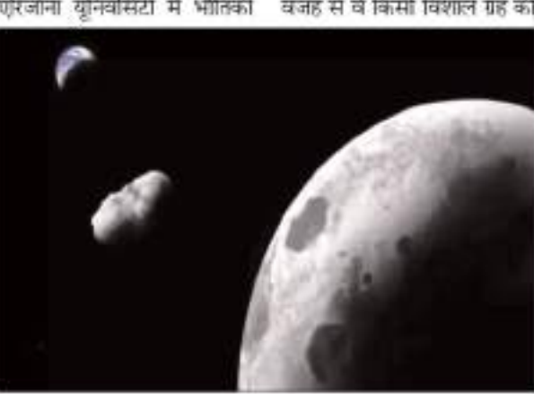
कक्षा सझा करते हैं। उल्कापिंड के प्रभाव से हुआ अलग शोध में कहा गया है कि

बलिक ऑब्सर्वल रोजेनेस की वजह से वे किसी विशाल ग्रह की इसकी पृथ्वी जैसी कक्षा और चंद्रमा के जैसे दिखने वाला यह हिस्सा चंद्रमा का ही हो सकता है। जो किसी उल्कापिंड प्रभाव से सतह से अलग हो गया होगा। इस विषय में अध्ययन के लिए शोधकर्ताओं ने अलग-अलग तरह की खगोलीय घटनाओं का अनुकरण किया। चंद्रमा के क्रेटरों का अध्ययन इसके अलावा चंद्रमा की सतह पर यूजुट क्रेटरों का भी अध्ययन किया गया और उसकी तुलना भी कामो' ओलेवा से की गई। वैज्ञानिकों के मुताबिक, इससे भविष्य में अभी यह पता लगाया होगा कि चंद्रमा पर क्या कौन सा ख़ास गढ़ा कामो ओलेवा का स्रोत हो सकता है।